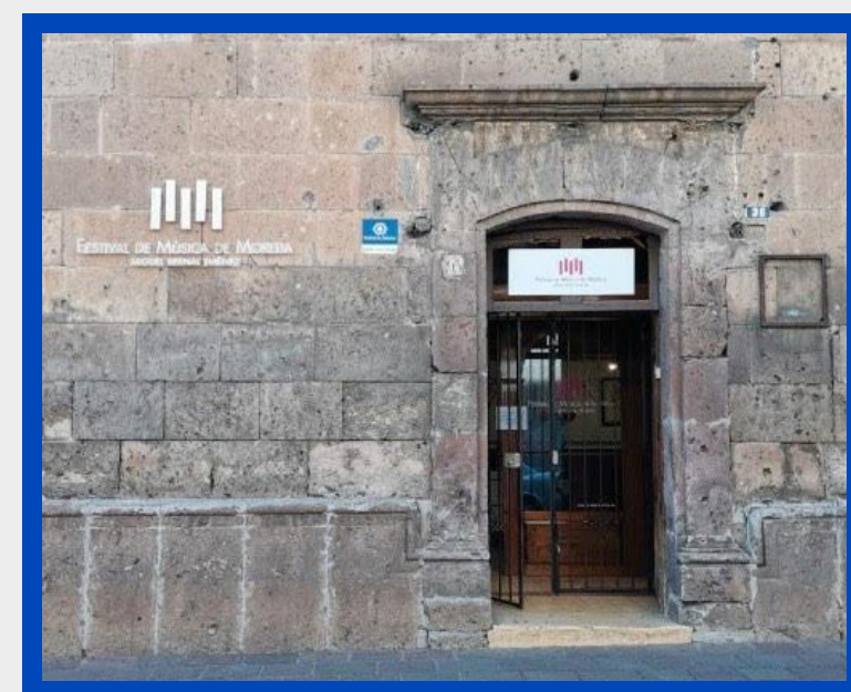
Oficinas del Festival Galeana #36 Col. Centro

Lunes a Viernes 12h a 20h Sábado 12h a 19h